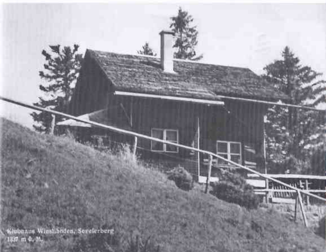
Klubhaus Wiesliboden, Sevelerberg 1837 m ü. M.